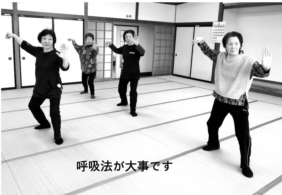
呼吸法が大事です