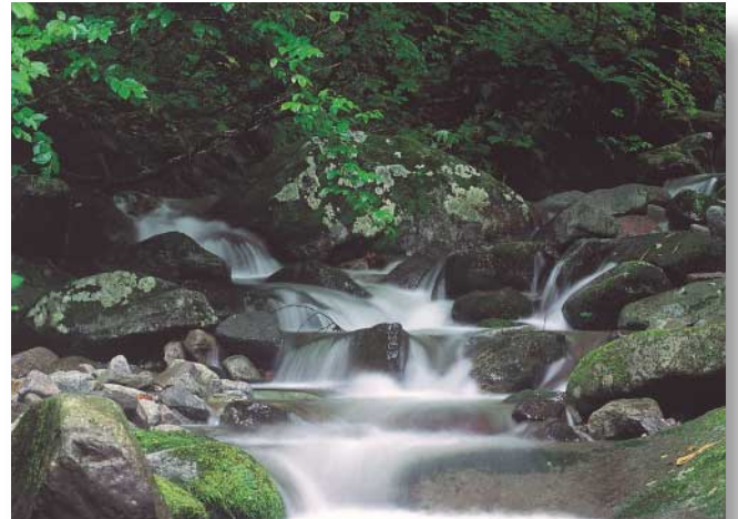
新緑の白爪沢（田代町岩瀬沢）