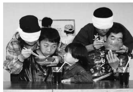
たけのご祭り(たけのご汁早喰い競争)

田代町の特産といえばまずあげられるのがタケノコ。そのタケノコを町おこしの一助にと始められたのが「たけのご祭り」(会場・田代町スポーツ公園多目的広場)で、6月13日に開催。今年で18回目を迎えたの。タケノコ皮むき競争などイベントが盛りだくさん。