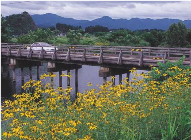
初夏の松峰橋（大館市釈迦内の下内川）