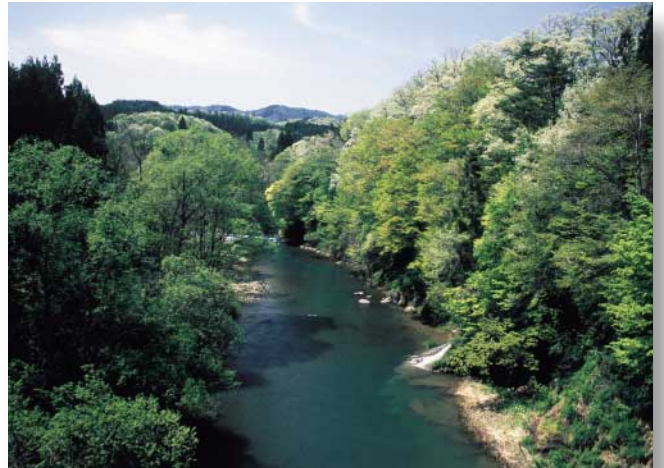
若葉の溪流(田代町の大岱橋で)