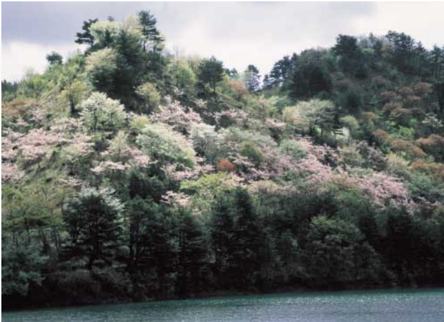
春の岩神山(大館市)