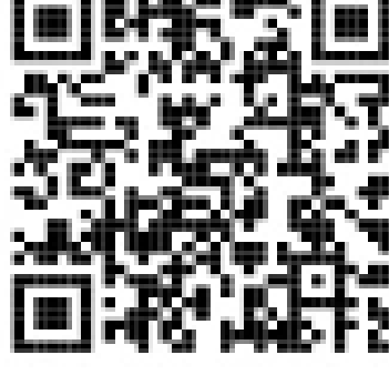
求職者マイページ

◎求職者マイページを使って「オンラインハローワーク紹介」などの各種サービスを受けるには左記の二次元コード（ハローワークインターネットサービス）から行ってください。 ※詳しくは、ハローワークの窓口までご連絡ください。