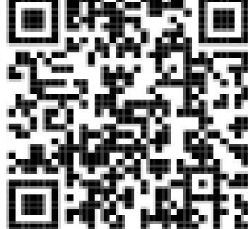
求職者マイページ

◎求職者マイページを使って「オンラインハローワーク紹介」などの各種サービスを受けるには左記の二次元コード（ハローワークインターネットサービス）から行ってください。 ※詳しくは、ハローワークの窓口までご連絡ください。