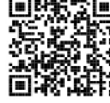
求職者マイページ

◎求職者マイページを使って「オンラインハローワーク紹介」などの各種サービスを受けるには左記の二次元コード（ハローワークインターネットサービス）から行ってください。※詳しくは、ハローワークの窓口までご連絡ください。