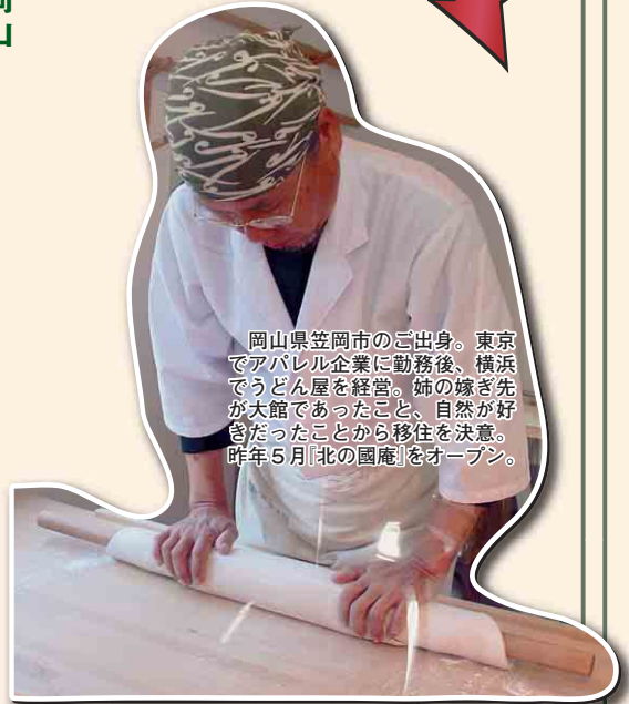
東京横浜出身。勤務後、嫁が先でアパレル企業に勤務。姉の嫁が先でうどん屋を営む。自然が好きだったことから移住を決意。昨年5月「北の國庵」をオープン。