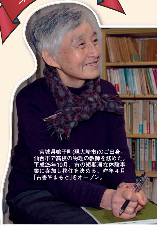
宮城県鳴子町(現大崎市)のご出身。仙台市で高校の物理の教師を務めた。平成25年10月、市の短期滞在体験事業に参加し移住を決める。昨年4月「古書やまもと」をオープン。