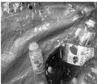
◀中身が残っていたもの時間が経つとカビで真っ黒になります。