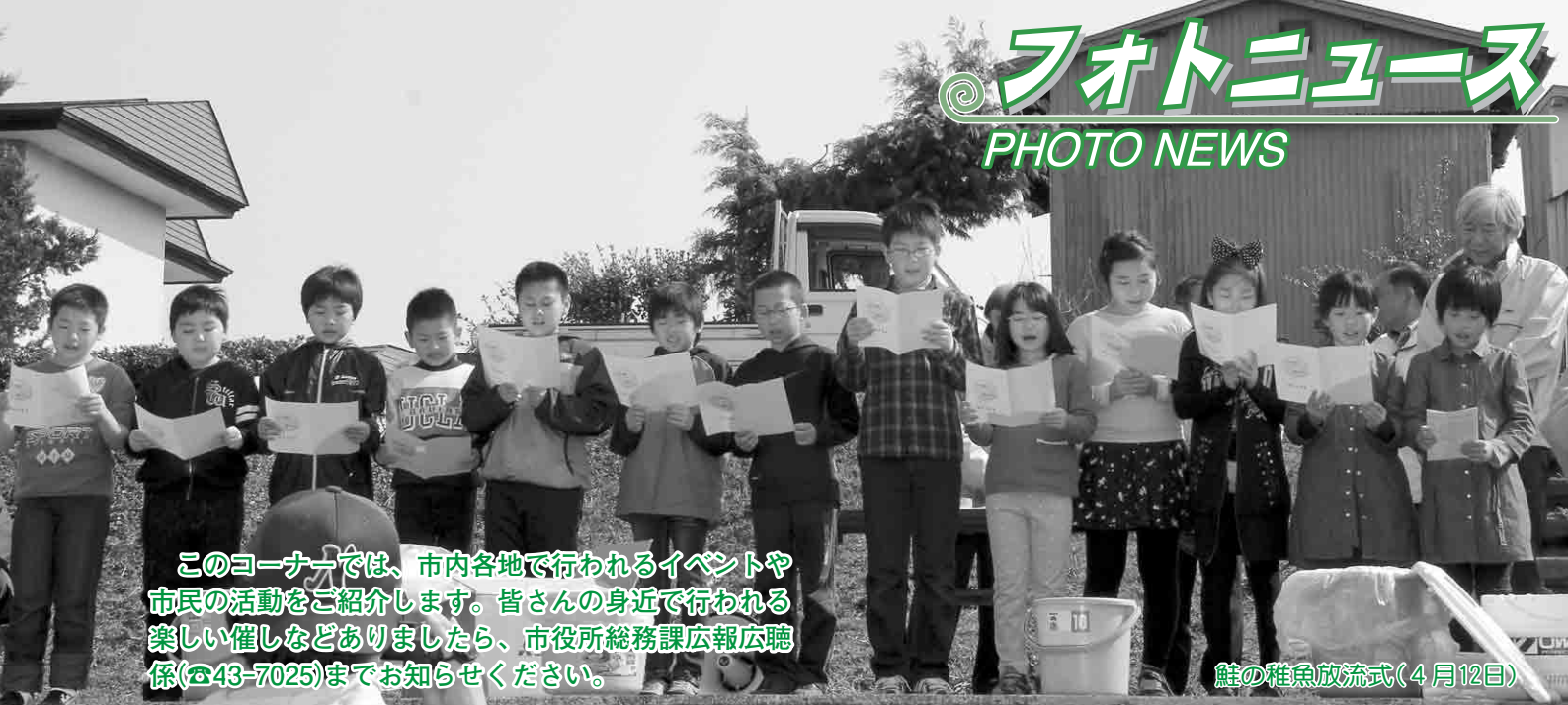
鯉の稚魚放流式(4月12日)

このコーナーでは、市内各地で行われるイベントや市民の活動をご紹介します。皆さんの身近で行われる楽しい催しなどありましたら、市役所総務課広報広聴係(☎43-7025)までお知らせください。