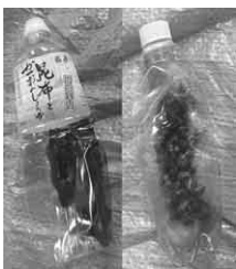
▲中に異物も×(左:昆布、右:カメムシ)

ふたは「燃やせるごみ」(金属の場合は「埋立ごみ」)です。必ず外して分別してください。