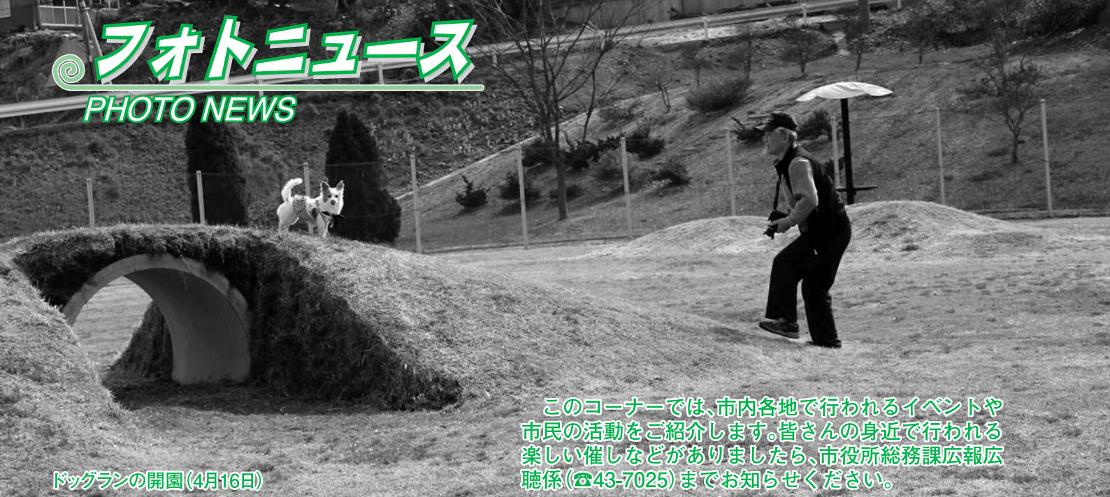
ドッグランの開園(4月16日)

このコーナーでは、市内各地で行われるイベントや市民の活動をご紹介します。皆さんの身近で行われる楽しい催しなどがありましたら、市役所総務課広報広聴係(☎43-7025)までお知らせください。