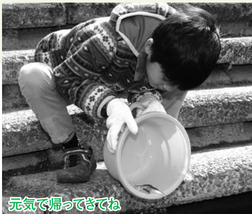
元気で帰ってきてね

参加者は、卵から大切に育てたかわいらしい稚魚に「元気で帰ってきてね」などと声を掛け、旅立つ姿を笑顔で見送りました。