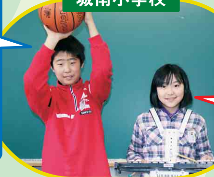
好きなものに触れると自然と笑顔になるネ！

家庭科などで習ったことを家で手伝いたい。プロバスケトボール選手を目指して、昨年よりも多く得点できるように、インサイドプレーとジャンプ力の強化を頑張ります！