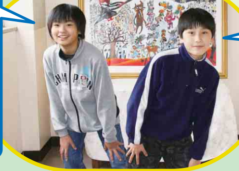
教頭先生納得のポーズが決まりました！

宿題を早い時間に終わらせるの、習いごとのピアノを頑張りたい！ 学校では苦手な算数と社会をしつかり勉強して、テストで良い点数がとりたいです。