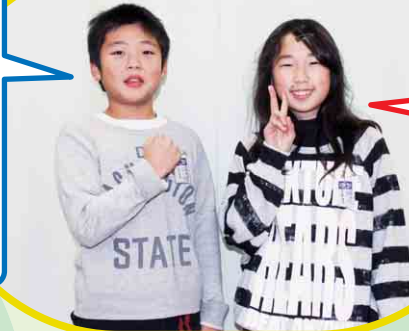
家族思いのやさしい2人！家でのお手伝い頑張ってる！

学校では、勉強と野球部をしつかり頑張ります！ 漁師になりたいので、今年は、休みの日におじいちゃんとか色々な海にしようちゅう出掛けたいです！