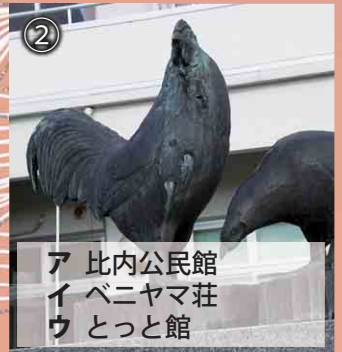
② ア 比内公民館 イ ベニヤマ荘 ウ とっと館