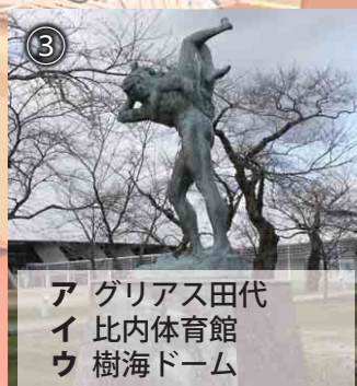
③ ア グリアス田代 イ 比内体育館 ウ 樹海ドーム