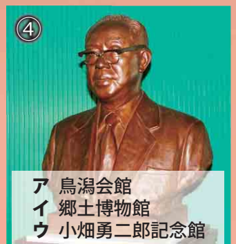
④ ア 鳥潟会館 イ 郷土博物館 ウ 小畑勇二郎記念館