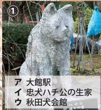
① ア 大館駅 イ 忠犬ハチ公の生家 ウ 秋田犬会館