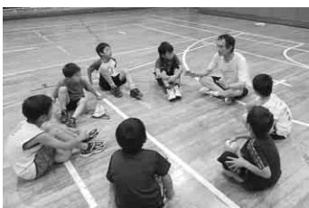
みなみスポ少の練習中のミーティング風景