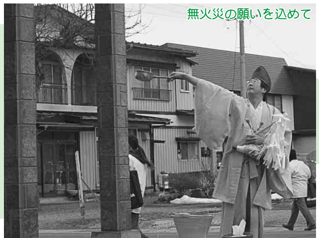
無火災の願いを込めて

今年もほら貝と錫杖の音を響かせながら、家々の軒先に水を掛けて扇田町内を練り歩き、火の用心を呼び掛けていました。