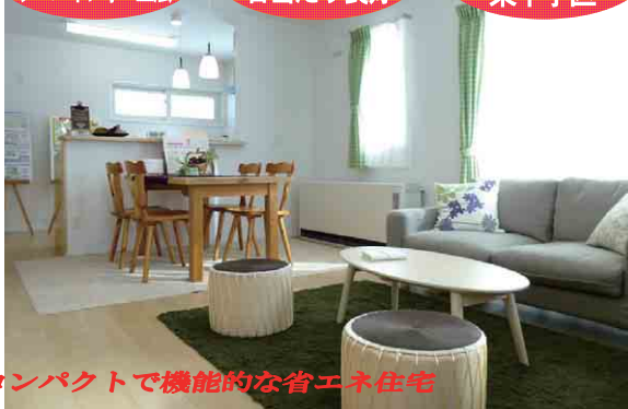
コンパクトで機能的な省エネ住宅

月々返済 55,252円 ボーナスなし 住宅ローン借入 1990万円 期間 35年 最優遇金利 0.9%(3年固定) 秋田・北都銀行で計算