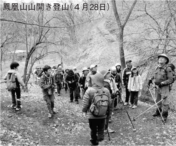
鳳凰山山開き登山(4月28日)

受診の際には、事前に「平成25年度健康ガイド」をご覧ください、受診時の注意事項や検診が無料になる場合、検診予定日などをご確認ください。 ※紛失したかたには、健康課が総務課で差し上げます。