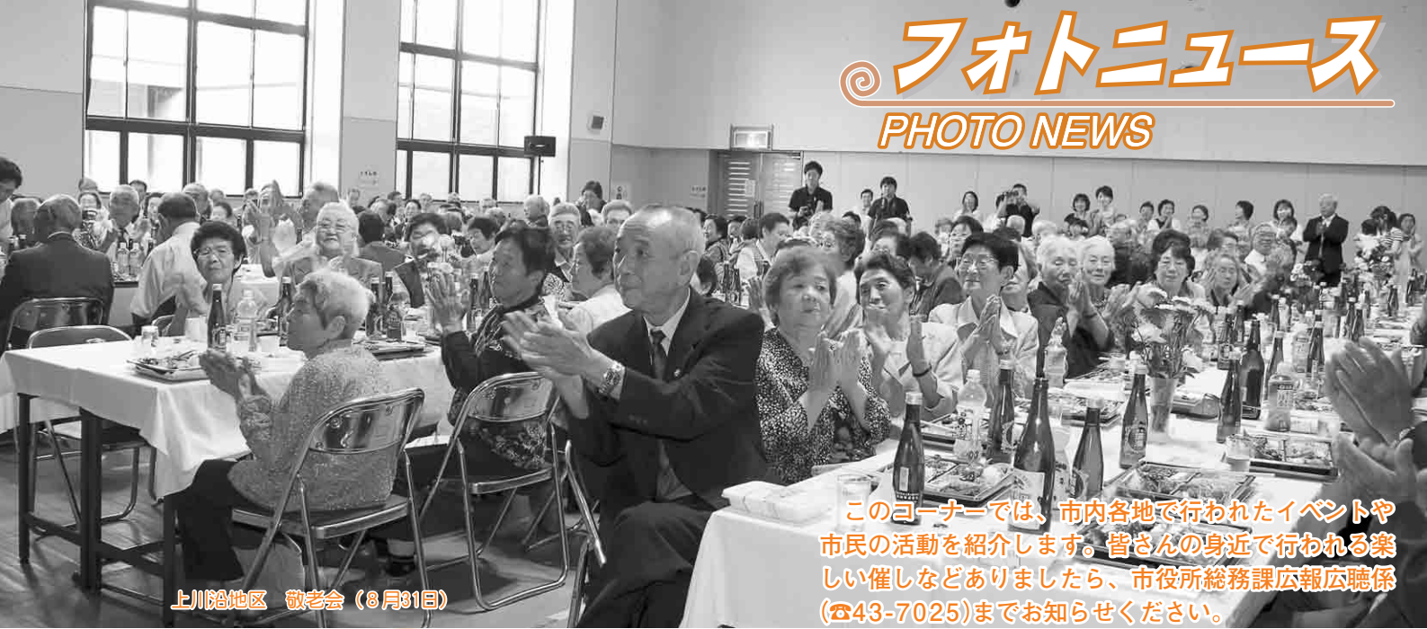
上川地区 敬老会 (8月31日)

このコーナーでは、市内各地で行われたイベントや市民の活動を紹介します。皆さんの身近で行われる楽しい催しなどありましたら、市役所総務課広報広聴係(☎43-7025)までお知らせください。