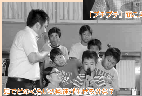
息でどのくらいの風速が出せるかな?

更に南極から持ち帰ったという本物の氷が登場すると、触ったり耳を近づけて音を聞いたり、大はしゃぎでした。