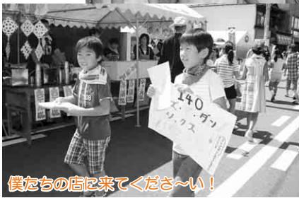
僕たちの店に来てくださ～い!