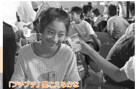
「プチプチ」聞こえるかな

2年ぶりとなる総合防災訓練を長木川河川敷で実施し、市や防災関係機関、住民合わせて約250人が参加しました。今回は昨年8月9日の豪雨をふまえて、降雨による水害と震度6強の地震という複合的な災害を想定した訓練となりました。初めてとなる炊き出し訓練では、陸上自衛隊と、秋田看護福祉大学の学生による機能別消防団が、参加者たちにカレーを振る舞いました。参加者は、安否確認やけが人救出などの訓練を通して、防災への意識を新たにしています。