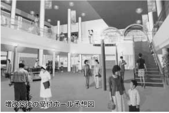
増改築後の受付ホール予想図

増改築事業 増改築に向けて基本設計や実施設計を行いました。 医療機器等整備事業 心臓カテーテル検査データ処理システムなどの医療機器を購入しました。