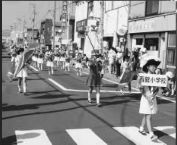
▶小学校ゴールデンパレード