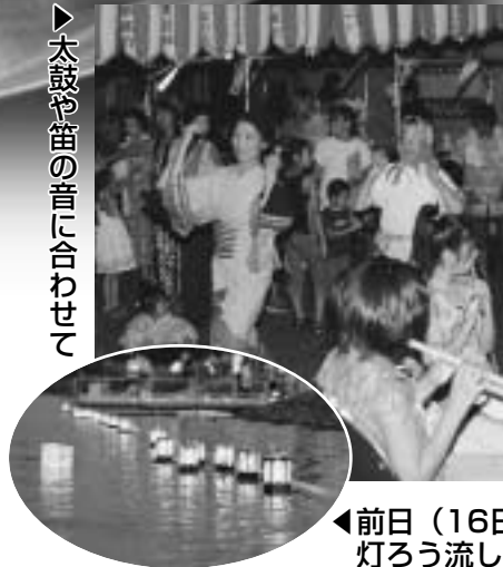
◀ 前日(16日)には、米代川で灯ろう流しが行われました