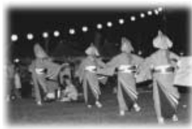
最後はしめやかに。

「あつてグッド」は、歩いて行くの方言「あつてえぐ」と会って良かった(グッド)を掛け合わせもじったものです。