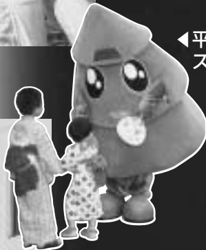
◀平成19年開催の秋田わか杉国体マスコット スギッチも登場!!