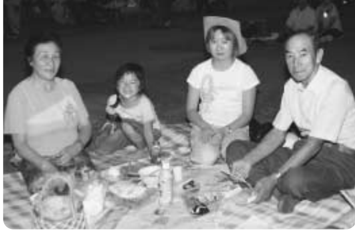
「今回の合併で、大館、比内、田代それぞれの地域が発展してもらえればいい」と隆さん。