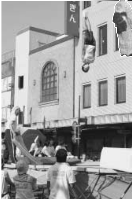
◀恒例となったトランポリンパレード