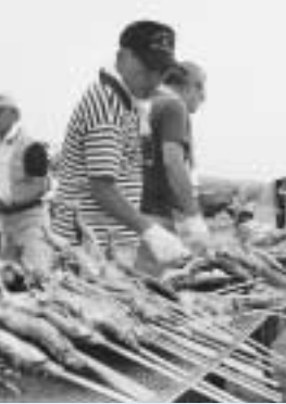
まつりの名物 「アユの千匹焼き」