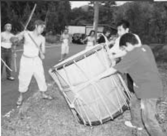
◀ 太鼓を叩いて練り歩きました