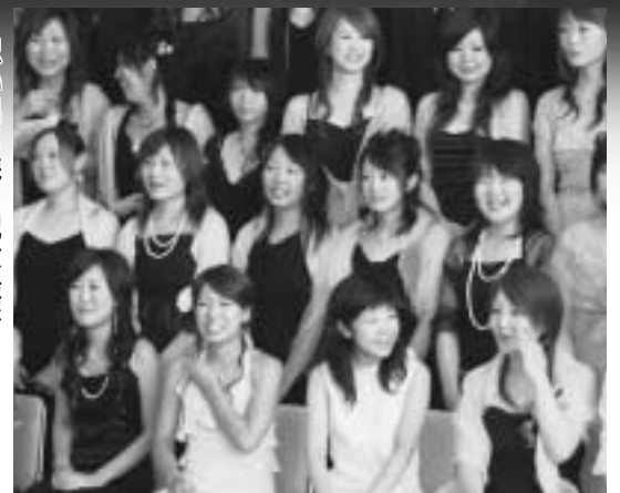
▶思い出に残る記念撮影