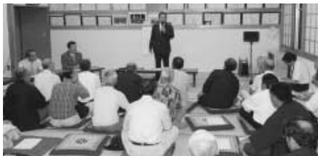
越山地区で行われた懇談会（7月25日）