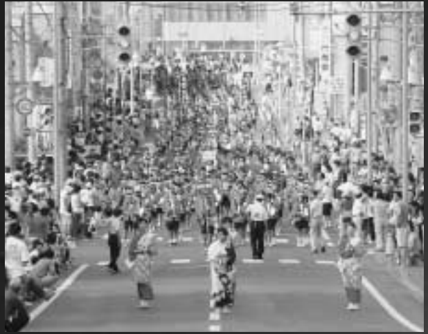
▲整然とした大文字踊り