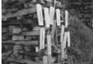
まき棚に張られたお札。 中には「おじいちゃんの病気が 早く治りますように」のお札も。