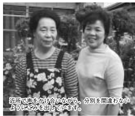
近所で声をかけ合いながら、分別を間違わないようにごみを出しています。

山田地区は、合併するだいぶ前から学校を通じてアルミ缶を集めているので、自動的にアルミ缶が分別される形になっています。収集業者のかたもアルミ缶については学校に届けてくれ