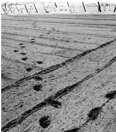
今年5月17日、中山地内に出没した熊の足跡