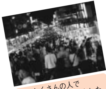
夜はたくさんの方にぎわいました。