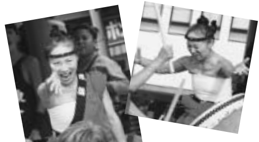
ごらんください、このパフォーマンス。

「あつてグッド」は、歩いて行くの方言「あつてえぐ」と会って良かった(グッド)を掛け合わせもじったものです。