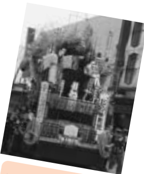
飾人形曳山車の相染講

9月に入っても、いまだ日中は猛暑の名残が幅をきかせているようですが、朝夕の涼しい風にびっくりすることも。ン？どこからともなく聞こえてくる笛太鼓。ピンゴ！大館神明社のお祭りで正解。このお囃子を聞いて、黙ってられる大館っ子なんかおりません。お祭りでにぎわう街中に突撃取材！