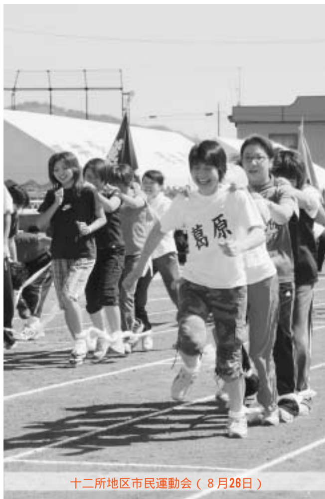
十二所地区市民運動会（8月26日）

接種料金 医療機関が定める接種料金(医療機関から1,000円減額された金額が請求されます)