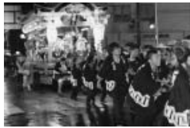
よいみや 宵宮の田乃坂越え、 力が入りました。