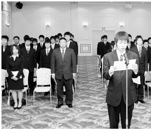
新入社員合同入社式(3月20日、プラザ杉の子)

一方、この春の就職状況は、市内高校卒業生の中で就職を希望した241人全員の就職が決定し、昨年度の就職率98.8%を上回りました。このうち、県内就