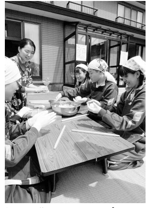
初めて作るきりたんぼ (5月17日)

大館地域でも「陽気な母さんの店」での農業体験を取り入れた修学旅行が行われるようになり、グリーン・ツーリズムのノウハウも蓄積されてきました。今後、一般の受け入れも含め、拡大策を検討していきます。