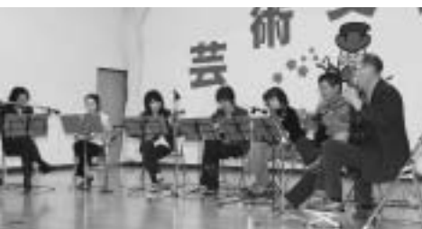
八木橋マンドリン愛好会の皆さんの演奏。