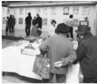
芸術文化祭では、多くの種類の展示物がありました。

市内の各公民館では、11月3日の文化の日を中心に文化祭が開かれます。書や絵画、工芸などの展示や、歌や踊り、楽器の演奏や民謡が披露され、各公民館は大にぎわい。今回は、数ある中から、比内芸術文化祭・商工祭におじゃましました。芸術文化祭は比内公民館、商工祭はお隣の比内体育館で開催されています。