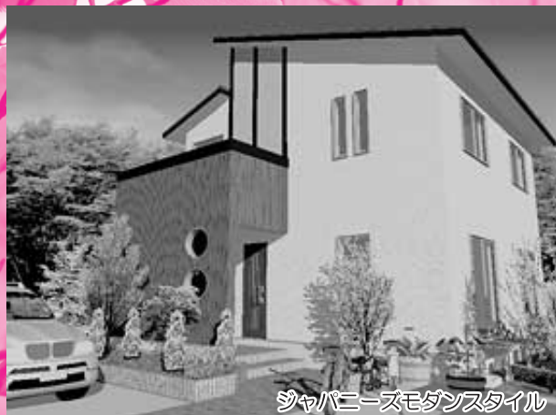
ジャパニーズモダンスタイル