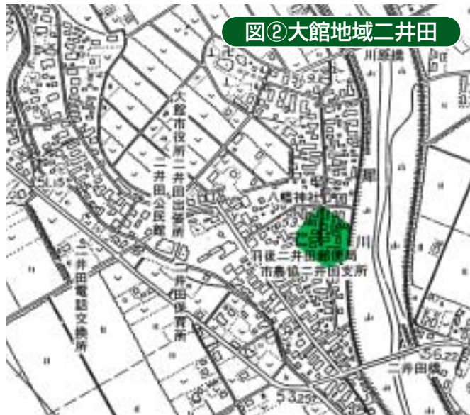
図②大館地域二井田