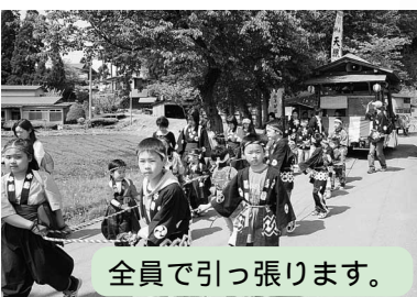
全員で引っ張ります。