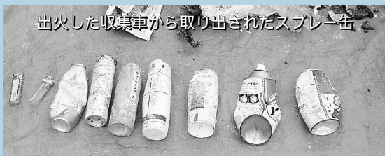
出火した収集車から取り出されたスプレー缶

飲食店や作業場、事務所などの事業所から出るごみは産業廃棄物で、ごみステーションには出せません。また農業資材(廃材)も産業廃棄物です。ごみカレンダーに記載の、廃棄物処理業者へ依頼してください。