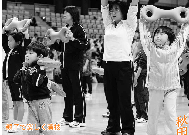
親子で楽しく演技

樹海体育館で「秋田3B体操のつどい」が開催され、全県から集まった600人ほどが、練習の成果を発表しました。