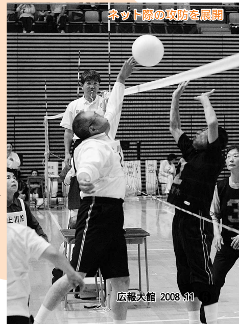
ネット際の攻防を展開

スポーツレクリエーション祭が市内の各会場で開かれ、各地区から集まった参加者がさわやかな汗を流しました。 樹海体育館では、8人制バレーボール、ソフトバレーボール、ラジボール卓球競技で熱戦が繰り広げられ、声援が送られる中、参加者はスポーツの秋を楽しみました。