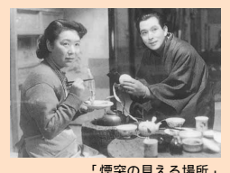
「煙突の見える場所」