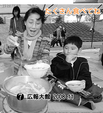
たくさん食べてね