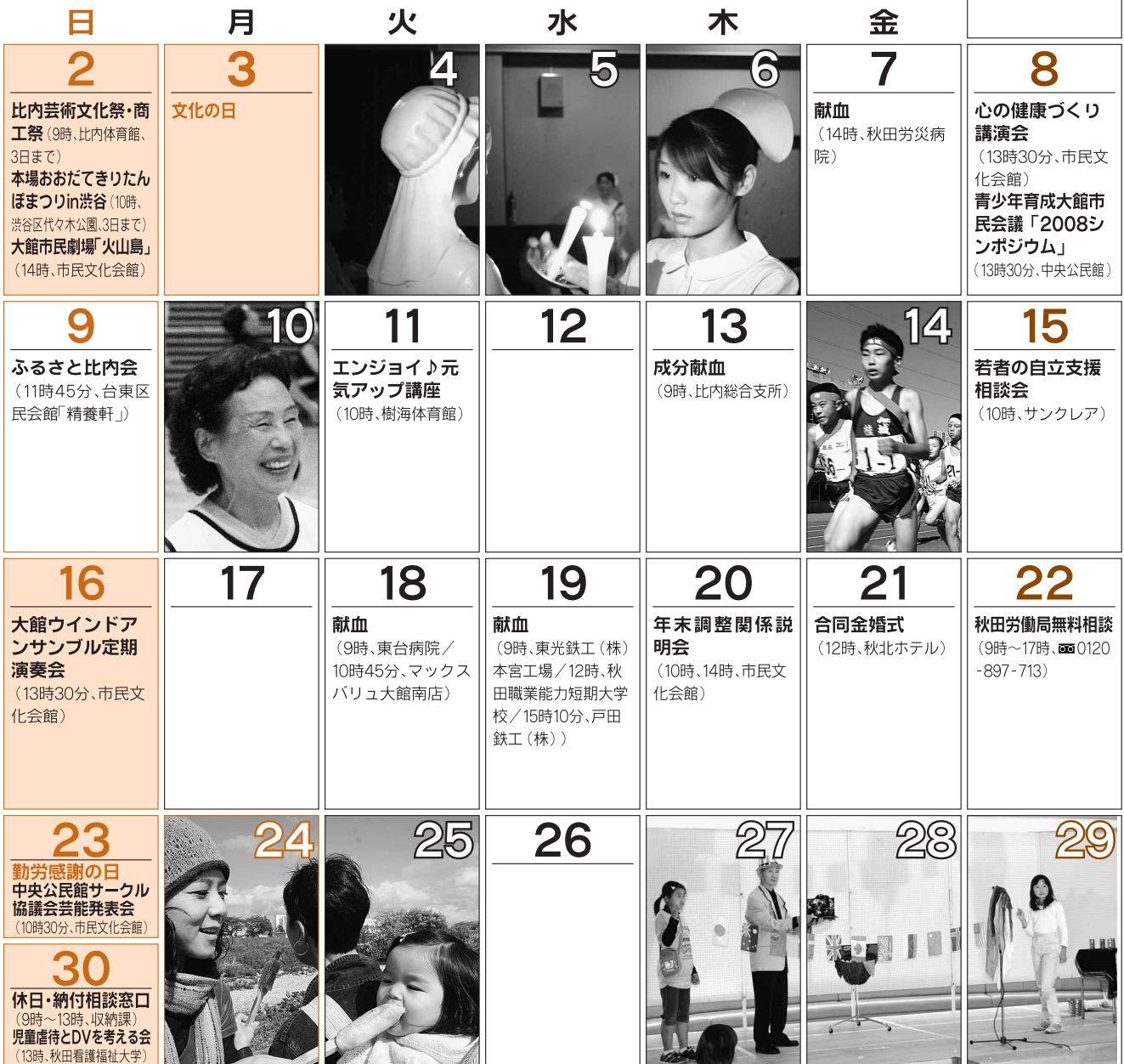
取材した市民の皆さんに登場していただきました