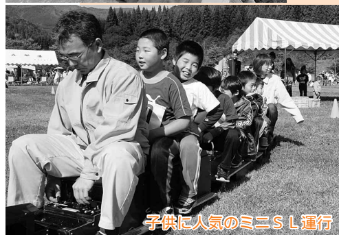
子供に人気のミニSSL運行

秋晴れの下、五色湖まつりが山瀬ダム多目的運動広場で開かれ、たくさん家族連れでにぎわいました。会場では、子供たちがミニSSLに乗ったり、ニジマスつかみ取りに挑戦したりして、笑顔いっぱい楽しんでいました。アユの塩焼きの販売などの出店も並び、来場者は周辺の色付き始めた山々を眺めながら、秋の味覚に舌鼓を打ち、五色湖の自然を満喫していました。