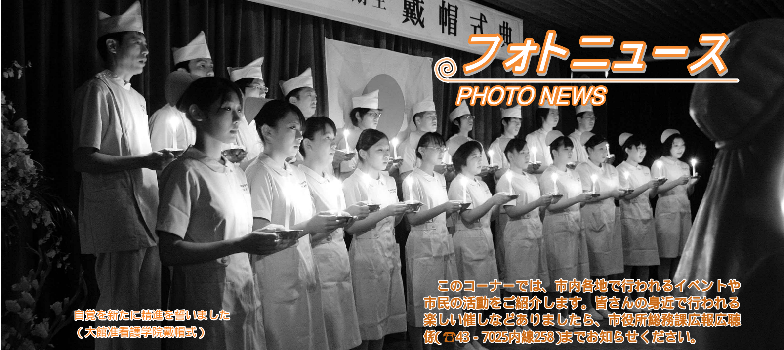
自覚を新たに精進を誓いました (大館看護学院戴帽式)

このコーナーでは、市内各地で行われるイベントや市民の活動をご紹介します。皆さんの身近で行われる楽しい催しなどありましたら、市役所総務課広報広聴係(☎43-7025内線258)までお知らせください。