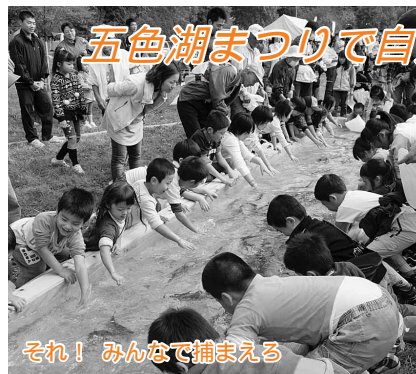
五色湖まつりで自然を満喫(10月12日)