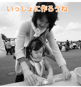
いっしょに作るうね

27チームが出場した小学校の部では、有浦小学校が山瀬小学校に競り勝ち、優勝を飾りました。