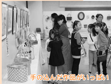
手の込んだ作品がいっぱい

第18回大館市生涯学習フェスティバル「まなびピアinおおだて」が開催され、日頃の学習成果を披露しました。