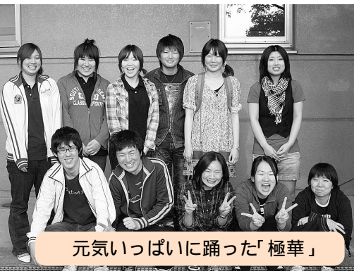
元気いっぱい踊った「極華」

「あつてグッド」は、歩いて行くの方言「あつてえぐ」と会って良かった(グッド)を掛け合わせ、もじったものです。