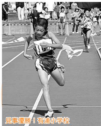
見事優勝!有浦小学校