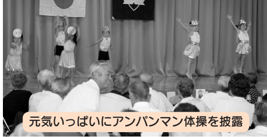
元気いっぱいアンパンマン体操を披露