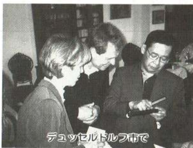
デュッセルドルフ市で