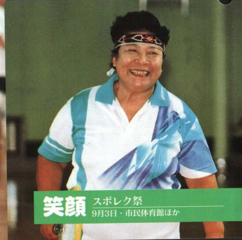
笑顔 スポレク祭 9月3日・市民体育館ほか