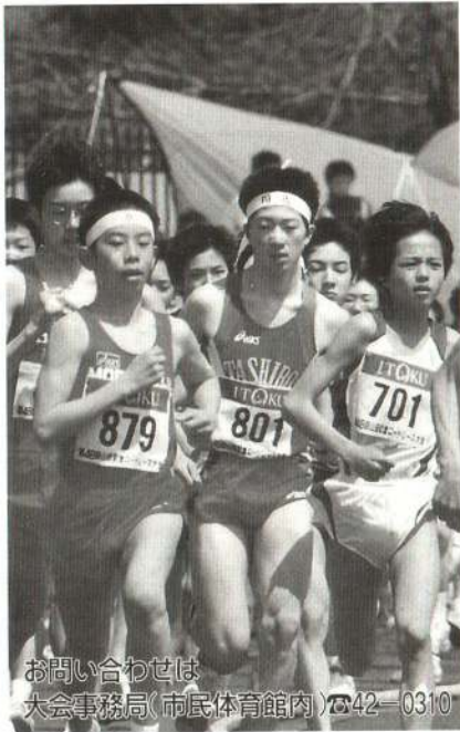
お問い合わせは 大会事務局(市民体育館内) ☎42-0310