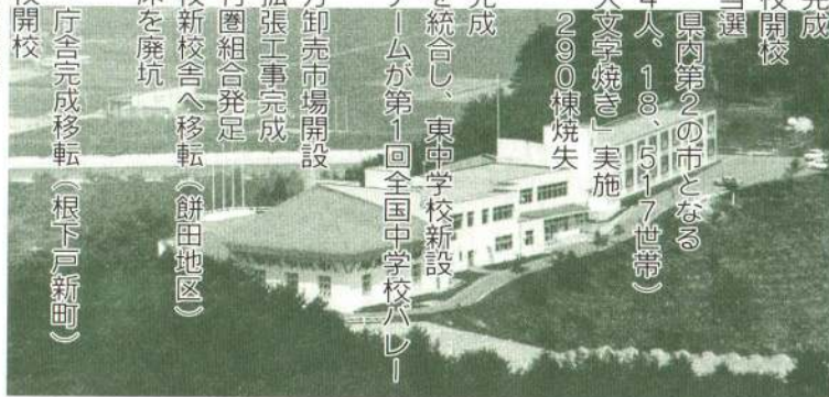
長根山の少年自然の家