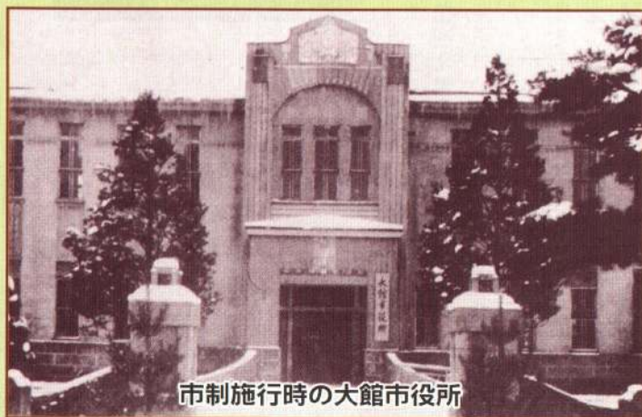
市制施行時の大館市役所