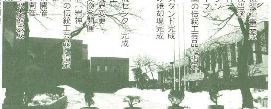
市民文化会館と中央公民館