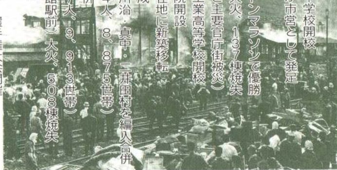
御成町1丁目(大館駅前)大火