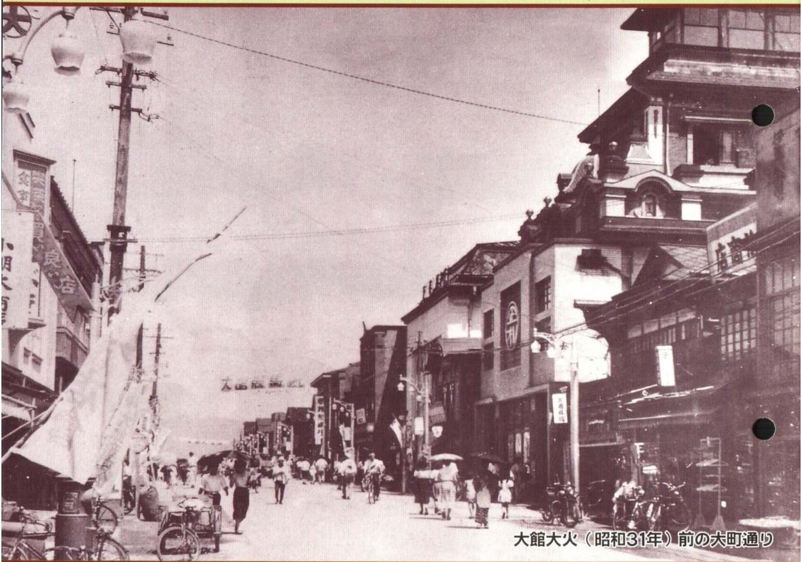
大館大火（昭和31年）前の大町通り