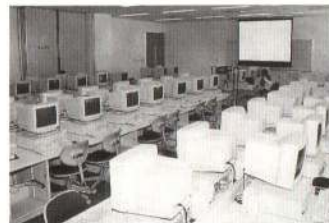
▼中央公民館 パソコンルーム

パソコンの基本操作、文書作成、インターネットや電子メールの利用などの基本的な技能を12時間の講習時間で学びます。