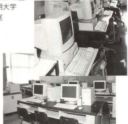
郷土博物館研究室