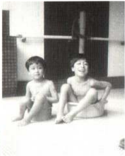
男湯と女湯、脱衣場から入ってびっくり、なんと混浴のお風呂でした。温泉大好きな2人です。