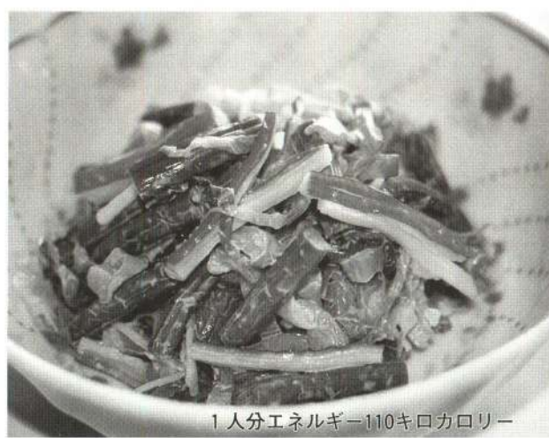
1人分エネルギー110キロカロリー