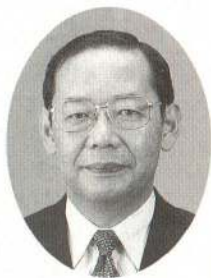
グリーン購入のすすめ

なお、今年度新たに受益者になったかたで、受益者負担金を全額一括して七月二日までに納めていただきますと一五パーセント割り引きされる報奨金制度がありますのでご利用ください。また、過年度分をまだ納めていないかたはお早めに納めてくださるようお願いいたします。 問 管理係（内線356）