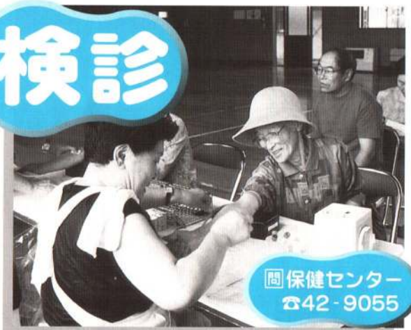
問 保健センター ☎42-9055