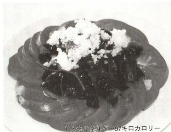
1人分エネルギー97キロカロリー

年中出回っているトマトですが、トマトといえばやっぱり夏。この時期、お日さまの光をいっぱい浴びたまっ赤なトマトは、動脈硬化予防に役立つリコピンが豊富になり、味も最高です。ワカメを添えた冷たいサラダでどうぞ。