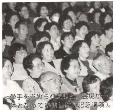
拳手を求められたりと、会場が一体となっていました(記念講演)。