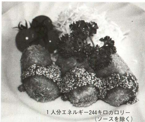
1人分エネルギー244キロカロリー (ソースを除く)