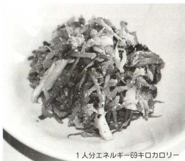
1人分エネルギー69キロカロリー

寒い夜は鍋を囲むのもいいですね。鍋物のはし休めに秋の食菜をふんだんに使ったごまあえはいかがですか。