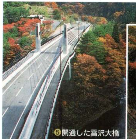
⑤開通した雪沢大橋