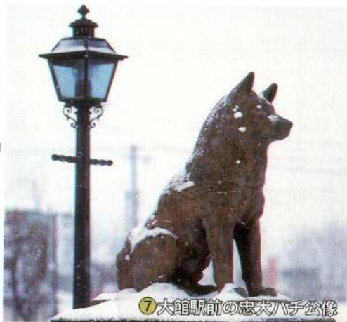
⑦大館駅前の忠犬八子公像