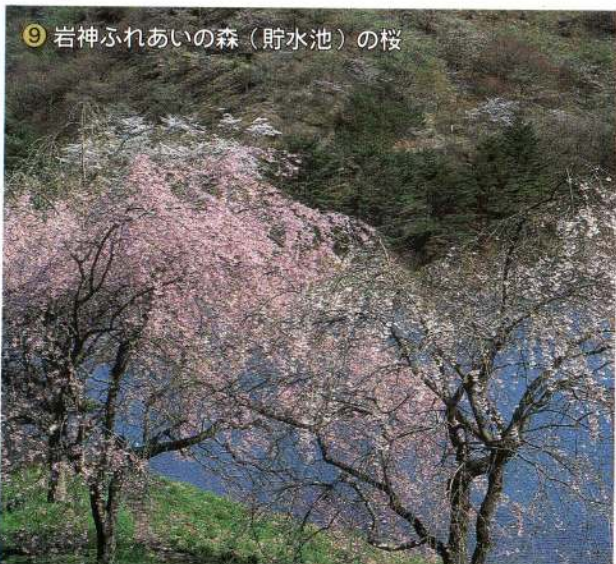
⑨岩神ふれあいの森（貯水池）の桜