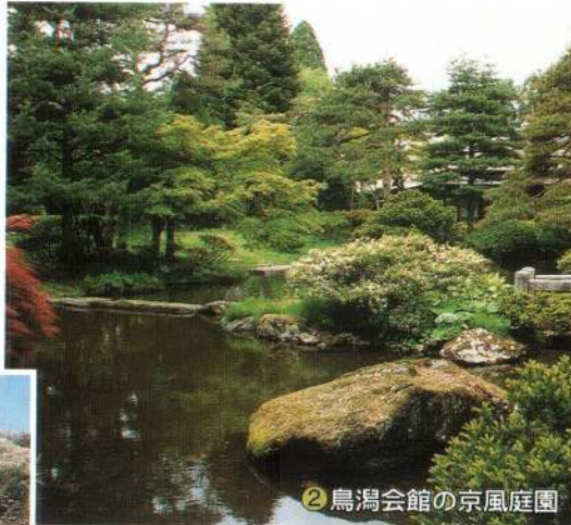
②鳥潟会館の京風庭園

市内の隠れた名所やすばらしい風景の写真を募集した「私のお気に入りの大館」。多くの応募の中からその一部をご紹介します。全ての作品をご紹介できなかったことをお許しください。