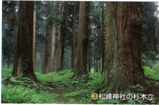
③松峰神社の杉木立