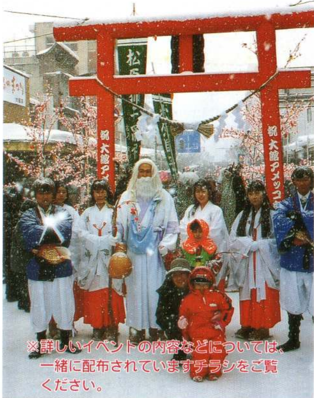
※詳しいイベントの内容などについては、一緒に配布されていますチラシをご覧ください。

今年から、2月の第2土曜日と翌日曜日に日程が変更され、一層の盛り上がりが期待されます。雪国の诗情あふれる祭りとして県内外から多くの観光客が訪れる「アメッコ市」。お友達、ご家族でお楽しみください。