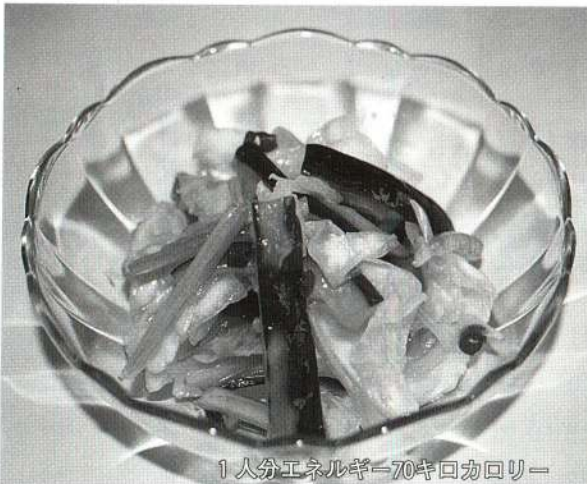
1人分エネルギー70キロカロリー