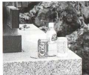
公園入り口に放置されたカン