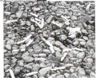
道端に捨てられた吸い殻

よりよい生活環境の中で快適な毎日を過ごすことができるよう、環境美化に向けた事業が実施されます。市民一人ひとりが自分の行動に責任を持ち、かけがいのない自然環境を守りましょう。