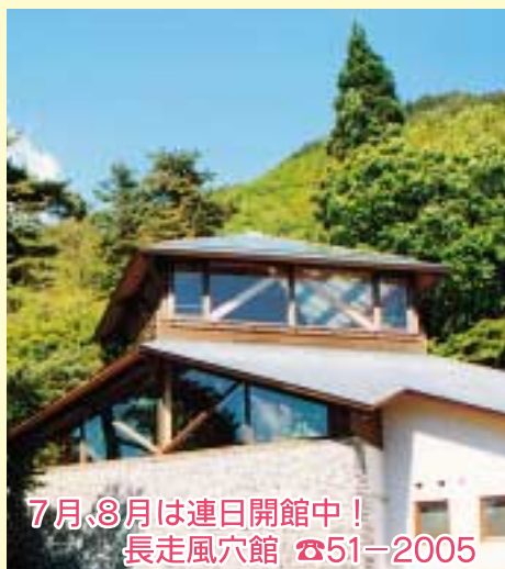
7月、8月は連日開館中! 長走風穴館 ☎51-2005