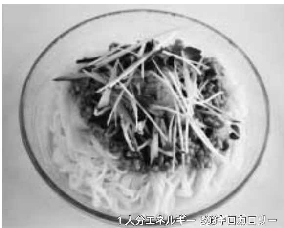
1人分エネルギー 503キロカロリー

夏バテ予防のために、肉や野菜をバランスよくとりたいたいものです。今回は、肉みそと野菜をたっぷりのせたボリュームのあるめん料理を紹介します。