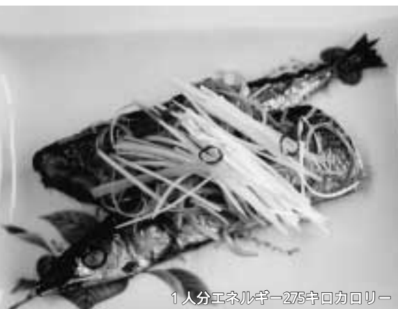
1人分エネルギー275キロカロリー

生サンマのおいしい季節です。ショウガとネギをたっぷり使ったタレで、塩焼きとは一味違ったサンマを味わってみませんか。