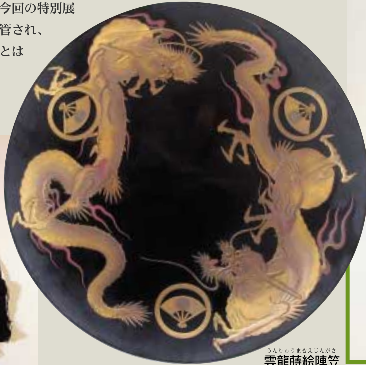
うんりゅうまきえじんがき 雲龍時絵陣笠