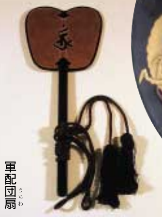
軍配団扇 つちむわ

中には漆塗りやトラ皮を用いた物もあり、展示による破損などの恐れから、今回の特別展が終わると、嚴重に保管され、当分の間は目には見ることができません。この機会にぜひ足をお運びください。