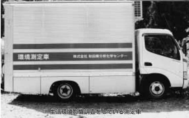
生活環境影響調査をしている測定車