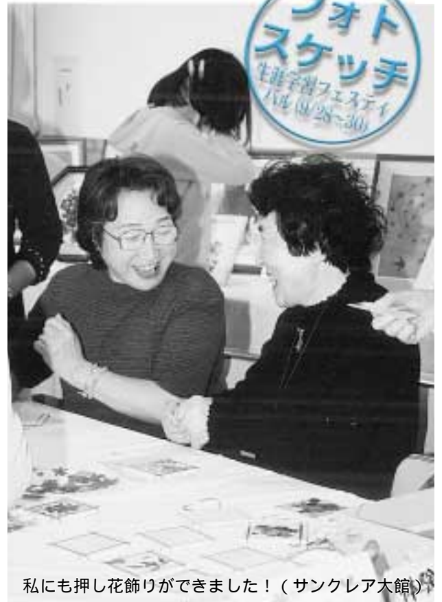
私にも押し花飾りができました!(サンクレア大館)