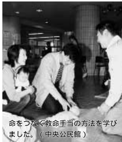
命をつなぐ救命手当の方法を学びました。(中央公民館)