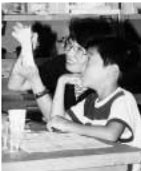
「長木川の水のpHはどれくらいかな？」(郷土博物館の子ども科学教室)