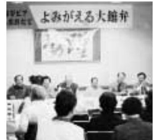
川柳とエピソードの各部の入賞者を発表しました。(よみがえる大館弁)