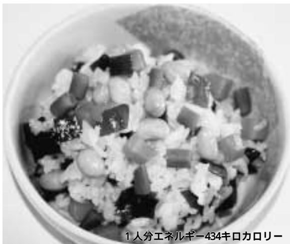
1人分エネルギー434キロカロリー