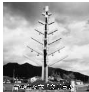
音の出る木「カリヨン」

国道103号を折れ、大滝温泉郷に入ると白いドームの建物が見えてきます。これが、温泉と温水プールがセットになって一年中楽しめる「湯夢湯夢の里」です。駐車場の入り口には杉を模した15mもの高さの音の出る木「カリヨン」がそびえ、日中は音楽で時刻を教えてくれます。平成2年に温泉施設が完成。隣接して、流水プールやウォータースライダー、25mプールなどを備えた温水プール施設が平成5年にオープンしました。流水プールやウォータースライダーで歓声を上げる子どもたち、子どもに水泳を熱心に教えているお父さん、健康のために一人で黙々と泳ぐかたなどその利用スタイルはさまざまです。また、暖かな