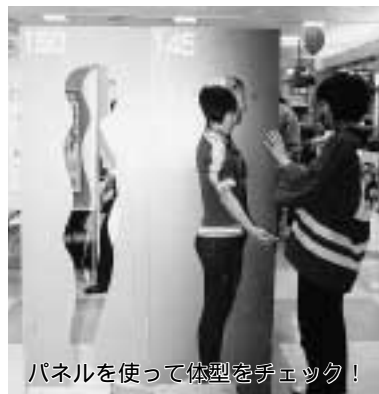
パネルを使って体型をチェック!