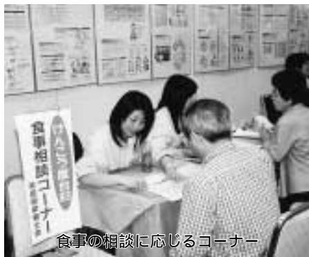
食事の相談に応じるコーナー