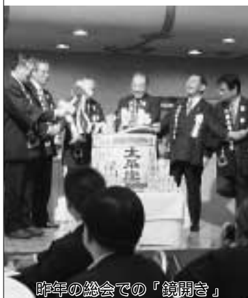
昨年の総会での「鏡開き」

文化講演会(土橋正幸氏・プロ野球マスターズリーグ「東京ドリームス」監督)、総会、懇親会 会費(中学生以下無料) 男性・9,000円