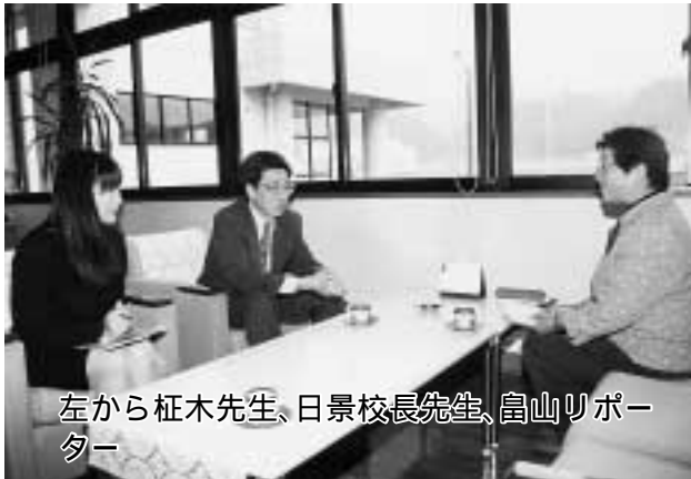
左から榎木先生、日景校長先生、富山リポーター