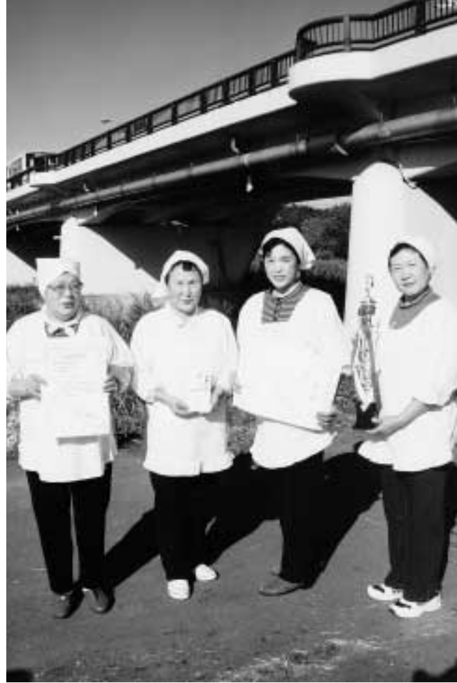
おらえのきりたんぼ鍋日本一コンテスト 最優秀賞 味彩仲好し組