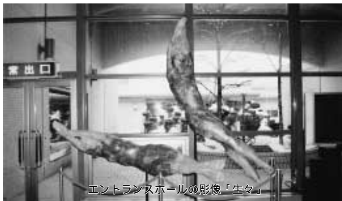
エントランスホールの彫像「生々」