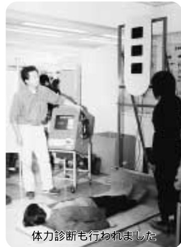
体力診断も行われました