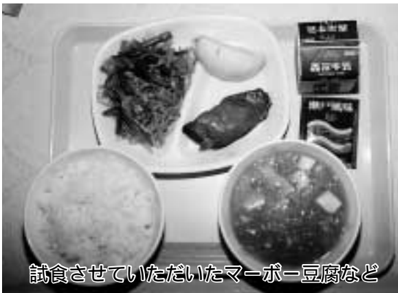
試食させていただいたマーボー豆腐など

お話を伺いながら、校長先生と一緒に試食をさせていただきました。この日のメニューは、ご飯と地場産のネギが入ったマーボー豆腐など