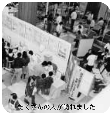
たくさんの方が訪れました