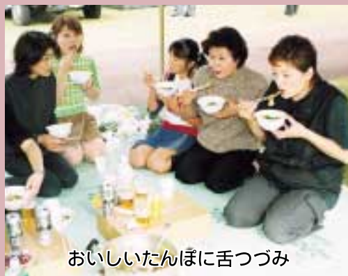
おいしいたんぼに舌つづみ