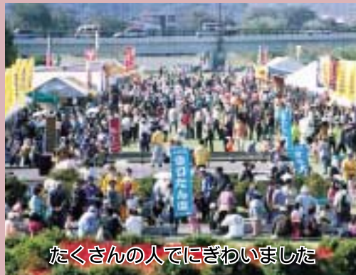
たくさんの人でにぎわいました