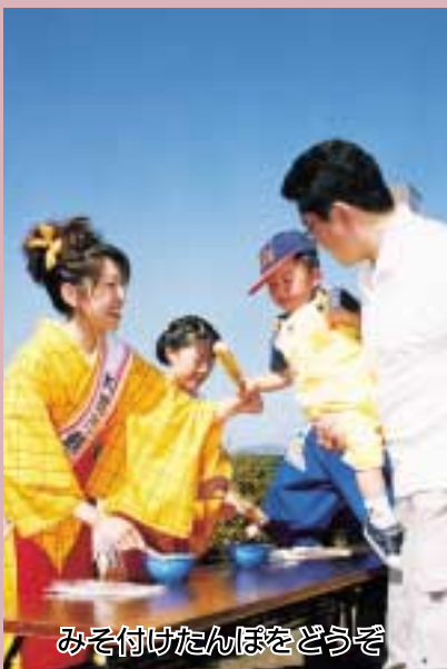
みそ付けたんぼをどうぞ