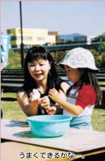
うまくできるかな...