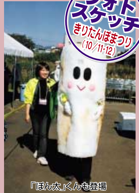
「ほん太」くんも登場