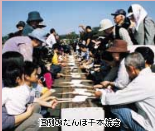
恒例のたんぼ千本焼き