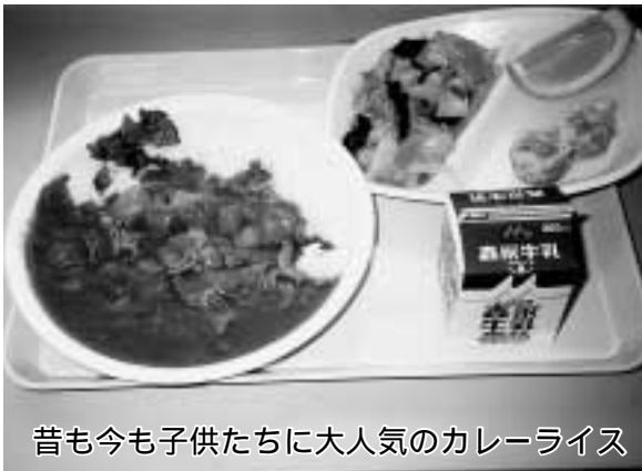
昔も今も子供たちに大人気のカレーライス

(A・榎木先生)病原性大腸菌O157が全国で話題となっており、特に生のまま出す食材はなくなりました。調理員が風邪を引いた場合には、休んでいたかどうかにしていきますし、手洗いの励行、調理室への入室時は専用の靴に履き替えていただくなど、考えられる対策はすべて行っています。