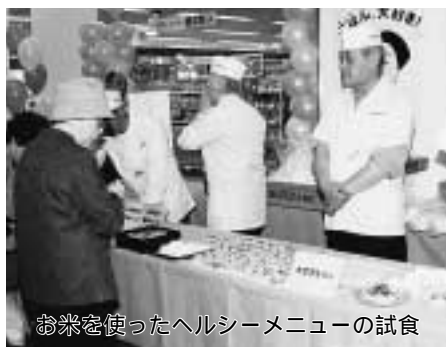
お米を使ったヘルシーメニューの試食