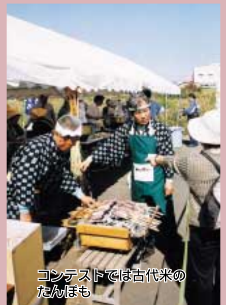
コンテストでは古代米の たんぼも