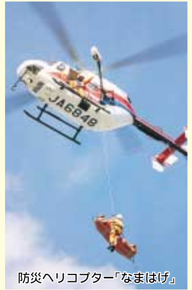
防災ヘリコプター「なまはげ」