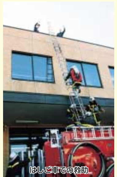
はしご車での救助