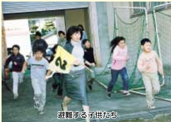
避難する子供たち