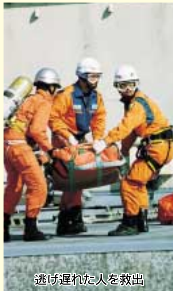
逃げ遅れた人を救出

10月20日、合同防災訓練が行われました。たくさんの方が参加し、防災への意識を高めるきっかけになりました。