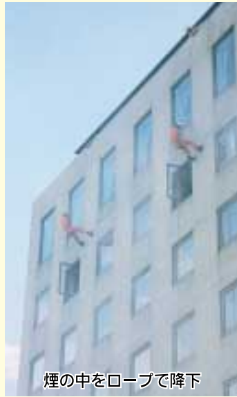
煙の中をロープで降下