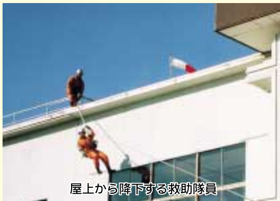
屋上から降下する救助隊員