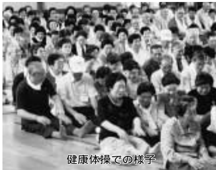
健康体操での様子