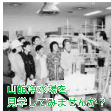
山館浄水場を見学してみませんか？

どのようにして安全な水が作られ、各家庭に配水されているかを、市民の皆さんにご理解いただくため、町内会やサークルなどの団体を対象に、山館浄水場の施設見学会を随時受け付けています。 見学を希望されるかたは直接山館浄水場へお申し込みください。 問 山館浄水場 ☎49 6669