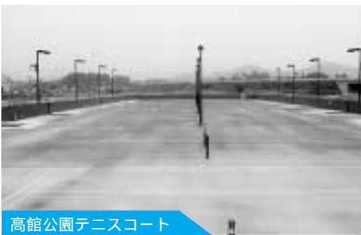
高館公園テニスコート