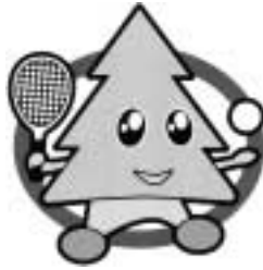
ソフトテニス競技