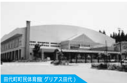
田代町民体育館(グリアス田代)