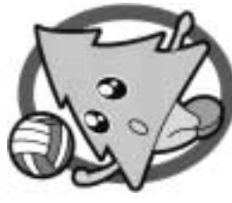
バレーボール競技