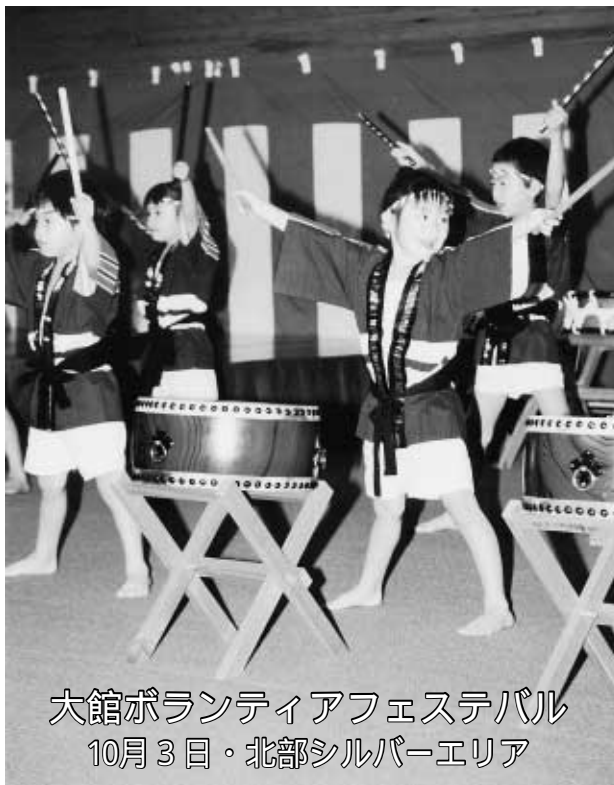
大館ボランティアフェスティバル 10月3日・北部シルバーエリア