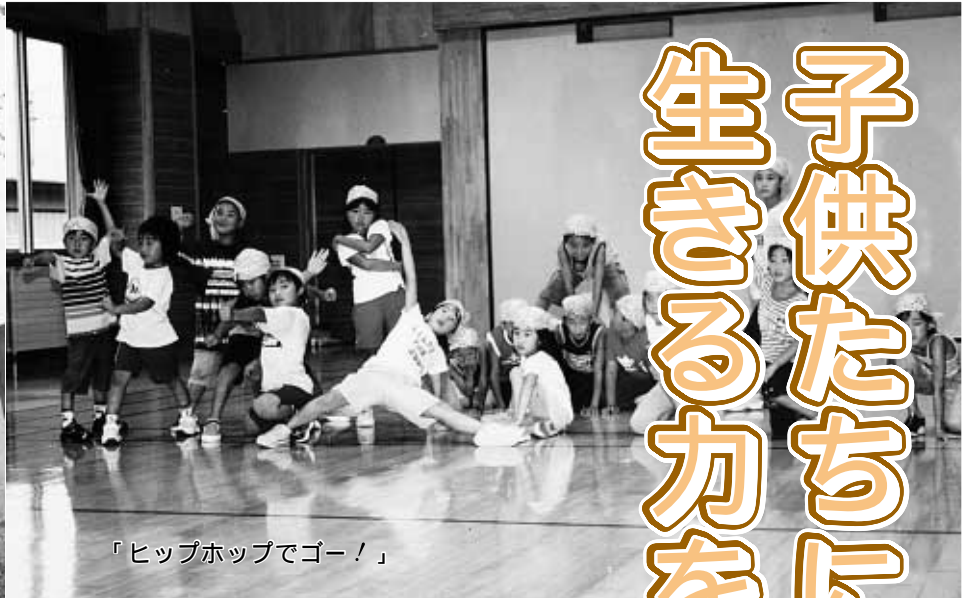
「ヒップホップでゴー！」