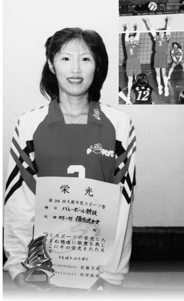
バレーボールと歩む人生