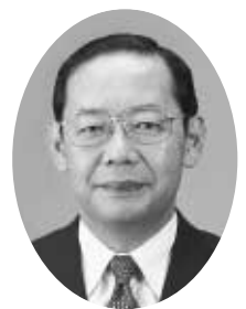
地産地消の意外な効果

⑤ 携帯電話からの通報 携帯電話(PHS含む)からの通報は、その旨を伝えてください。また、地元の消防本部につながる場合もあります。住所を伝えるときには「大館市」であることを最初に告げてください。通報後しばらくの間は、電話を切らずに現場近くの安全な場所で待機してください(再確認する場合があります)。