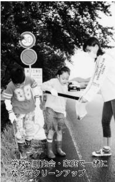
学校・町内会・家庭と一緒に なってクリーンアップ